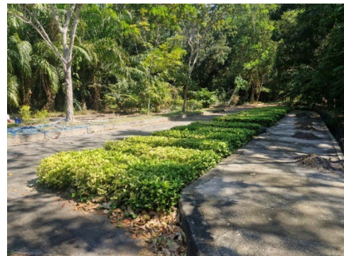
ภาพที่ 2-28 เรือนเพาะชำของโครงการ