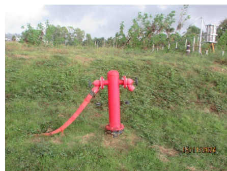
ภาพที่ 2-24 หัวจ่ายน้ำดับเพลิง ตามแนวถนนของพื้นที่โครงการ