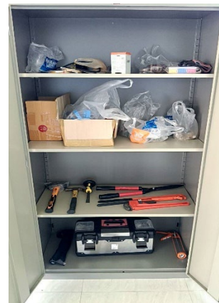
ภาพที่ 2-31 อะไหล่หรืออุปกรณ์สำรอง ของระบบบำบัดน้ำเสียส่วนกลาง