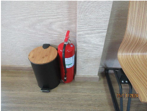
ภาพที่ 2-25 อุปกรณ์ป้องกันอัคคีภัยภายในสำนักงานนิคมฯ