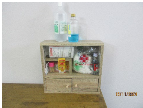
ภาพที่ 2-27 เวชภัณฑ์และยาเพื่อใช้ในการปฐมพยาบาลเบื้องต้น