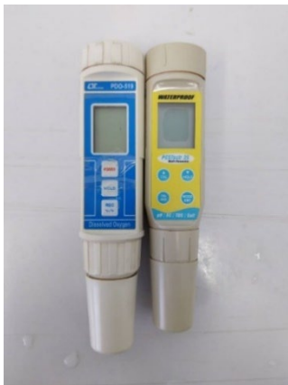
ภาพที่ 2-30 อุปกรณ์ตรวจวัดออกซิเจนละลาย

ภาพที่ 2-29 เครื่องตรวจวัดลักษณะน้ำทิ้งแบบต่อเนื่องบริเวณบ่อตรวจสอบคุณภาพน้ำทิ้งที่ผ่านการบำบัดแล้ว (COD Online / BOD Online / pH Online / Conductivity Online)