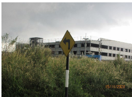
ภาพที่ 2-15 ป้ายกำหนดความเร็ว ไม่เกิน 40 กม./ชม.