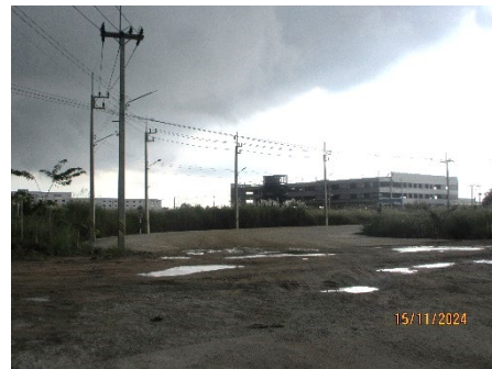
ภาพที่ 2-18 การติดตั้งโซล่าเซลล์บริเวณจุดตัดในพื้นที่นิคมฯ