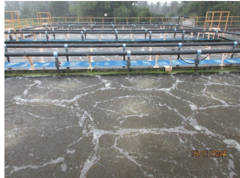
ภาพที่ 2-5 บ่อเติมอากาศ