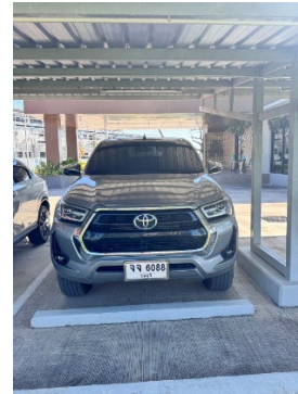
ภาพที่ 2-26 รถรับส่งกรณีฉุกเฉิน