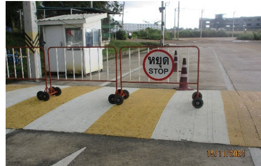
ภาพที่ 2-14 ป้ายเครื่องหมายจราจรภายในพื้นที่โครงการ