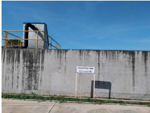
ภาพที่ 2-4 บ่อรวบรวมน้ำเสียก่อนเข้าระบบ