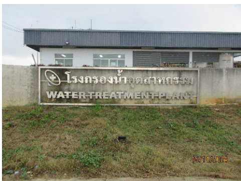
ภาพที่ 2-11 ระบบผลิตน้ำใสของนิคมฯ