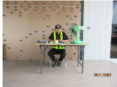
ภาพที่ 2-17 เจ้าหน้าที่รักษาความปลอดภัยภายในโครงการ