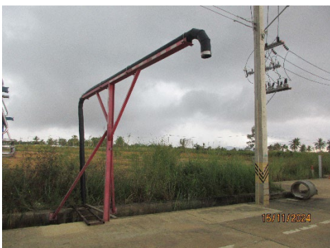
ภาพที่ 2-2 จุดรับน้ำทิ้งภายหลังการบำบัดแล้วไปร่น้ำต้นไม้ ภายในนิคมฯ