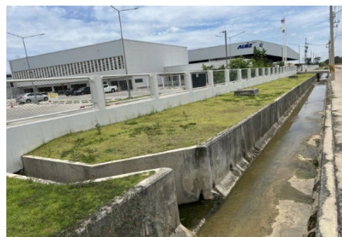
ภาพที่ 2-3 Inspection Manhole