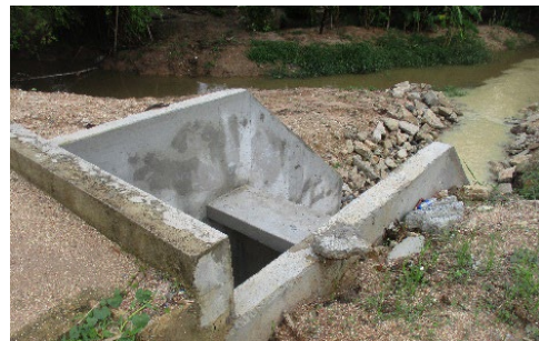
ภาพที่ 2-9 ประตูระบายน้ำและอาคารสลายพลังงาน (Stilling Basin)