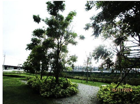
ภาพที่ 2-1 พื้นที่สีเขียวและแนวกันชนโดยรอบพื้นที่โครงการ