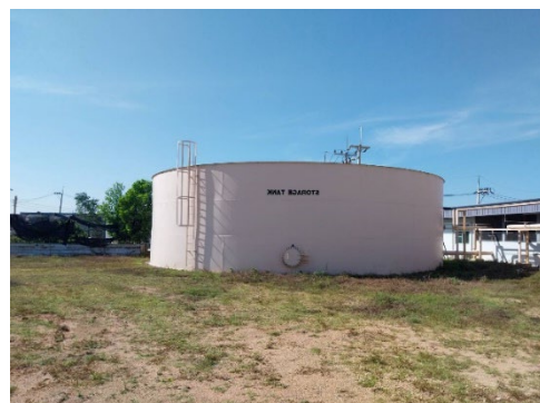
ภาพที่ 2-12 ถังสำรอน้ำประปาของนิคมฯ