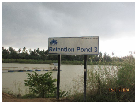
บ่อหน่วงน้ำ (แห่งที่ 3)