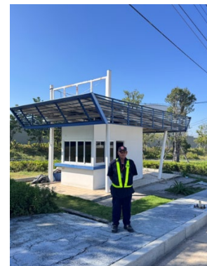
ภาพที่ 2-16 เจ้าหน้าที่รักษาความปลอดภัย บริเวณทางเข้า-ออกโครงการ