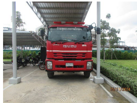
ภาพที่ 2-23 รถดับเพลิงชนิดอเนกประสงค์