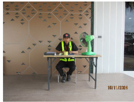
ภาพที่ 2-21 ศูนย์รับเรื่องร้องเรียนบริเวณสำนักงานนิคมฯ