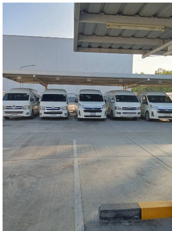
ภาพที่ 2-32 รถรับ-ส่งพนักงานของโรงงาน