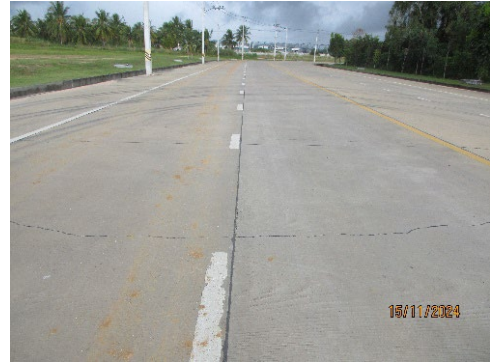
ภาพที่ 2-13 เส้นแบ่งจราจรภายในโครงการ