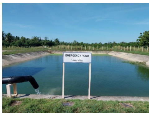
ภาพที่ 2-8 บ่opakน้ำทิ้งฉุกเฉิน ระบบบำบัดน้ำเสียส่วนกลางของนิคมฯ