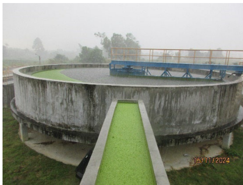
ภาพที่ 2-6 บ่อดักตะกอน