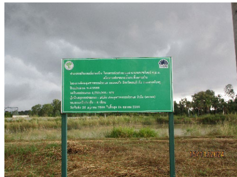
ภาพที่ 2-10 ทางสาธารณประโยชน์ที่พาดผ่านพื้นที่โครงการ