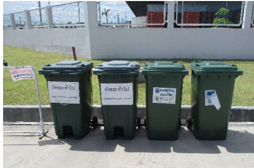
ภาพที่ 2-20 ภาพขณะรองรับขยะมูลฝอยของโรงงาน