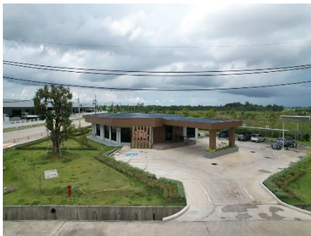
ภาพที่ 2-22 สำนักงานนิคมอุตสาหกรรมโรจนะ แห่ลมนั่ง