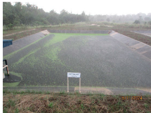
ภาพที่ 2-7 บ่opakน้ำทิ้งสุดท้าย